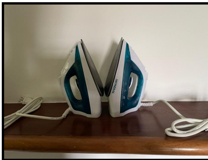
FERRO DE PASSAR A VAPOR (02 UNID.) (MONDIAL)