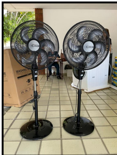
VENTILADOR (02 UNID.) (MALLORY)