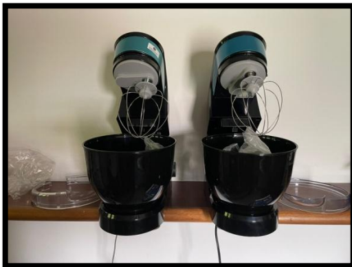
BATEDEIRA PLANETÁRIA (02 UNID.) (PHILCO)