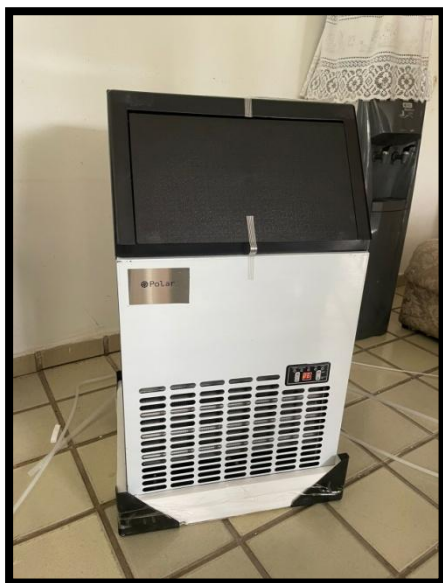
MÁQUINA DE GELO (02 UNID.) (POLAR)