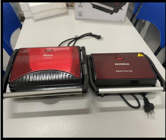
GRILL e SANDUICHEIRA (02 UNID.) (MONDIAL)