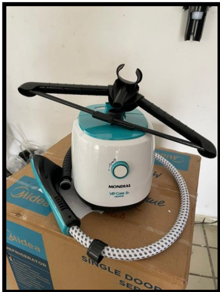
PASSADEIRA A VAPOR (MONDIAL)