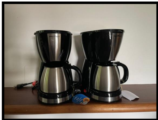
CAFETEIRA (02 UNID.) (BRITÂNIA)